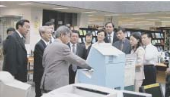
（自動貸出返却装置の操作説明）

日中平和友好条約締結25周年記念訪日団として来県中の人材協力代表団が、8月26日（火）学長表敬のあと、附属図書館のサービスコーナーや特別資料室等館内を熱心に見学されました。