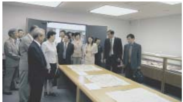
（特別資料室で金沢古地図などを見入る）