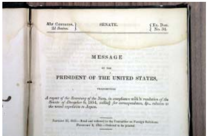
ペリー提督の『遠征記録』標題誌

將軍宛ペリー提督書簡の数の違いも、『遠征日記』に記述されている内容とも合致しており、『日本遠征記』との違いは、およそ150年前の刊行当初からあり、『遠征日記』が初出ではなく、この『遠征