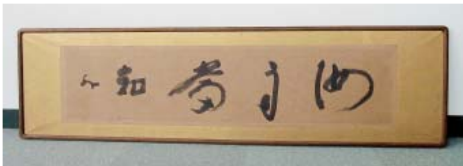
暁烏敏筆「汝自当知」の扁額 「没後50年記念 暁烏敏展」で展示します。 （第10ページ参照）