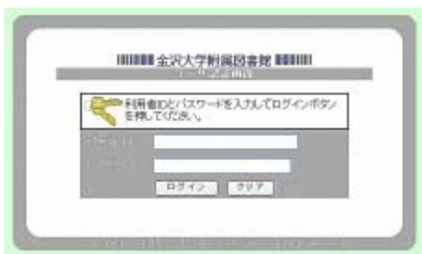
ID・パスワードによる認証画面

平成14年度にILLサービスをご利用になられた方及び図書館利用券を既にお持ちの方には3月上旬にID・パスワードの初期値を配布済です。それ以外の方でご利用になりたい方は、図書館利用券の発行手続きをお願いいたします。中央図書館、分館の閲覧カウンターまでお申込み下さい。