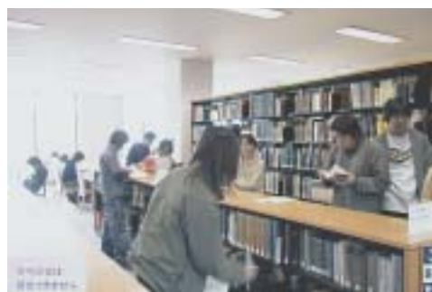
授業風景 参考図書を使って,調べてみよう

*また,総合科目とは別に,図書館では館内ツアーや説明会を開催します。ぜひ図書館に足を運んでみて,参加してみてください。(参考調査係)