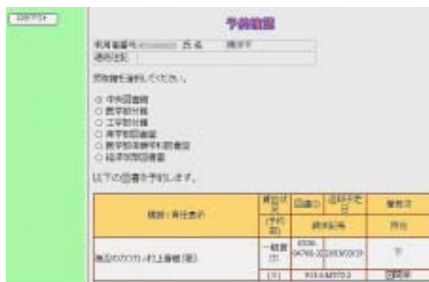
詳細結果画面から予約

これらのサービスは, 図書館HPの「蔵書検索OPAC」のページから利用できます。予約・照会の場合はID・パスワードが必要になります。