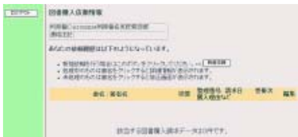
依頼済の図書の内容を表示

(注) 予算コード: 利用者ごとに予算コードが設定されています。該当する予算コードが入っていない場合は, 図書館総務係までご連絡下さい。