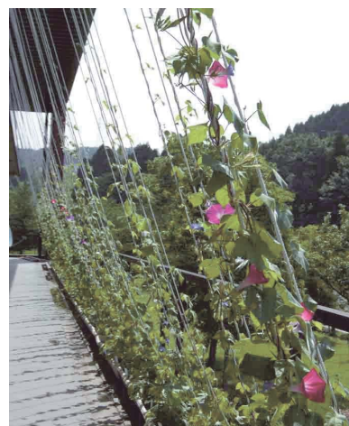
● 「明後日(あさって)朝顔」プロジェクト2009 in金沢大学中央図書館(7月)