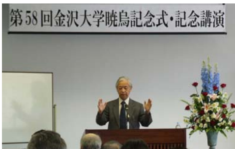
● 暁烏記念講演会 記念式は平成19年度で58回を迎えた。