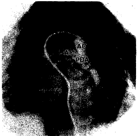
図 2. 心カテーテル検査所見 下行大動脈と同径の約 9 mm の PDA を認めた。