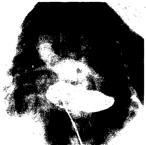
図 1. 心カテーテル検査所見 肺動脈閉鎖, PDA, TGA, 共通房室弁孔の所見であった。

心カテーテルおよび造影所見: 肺動脈閉鎖、PDA、大血管転位、共通房室弁孔、左上大静脈遺残の所見を認めた (図 1)。PDA は直径 9 mm で下行大動脈と同径であった (図 2)。肺動脈圧は 44/26 (平均 32) mmHg と上