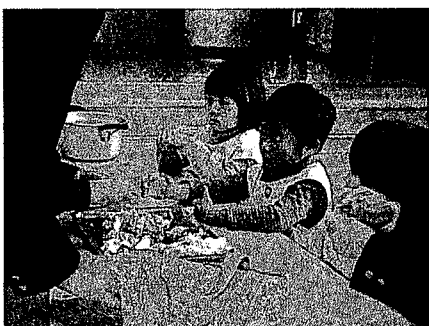
写真2 みそ汁の具をちぎる