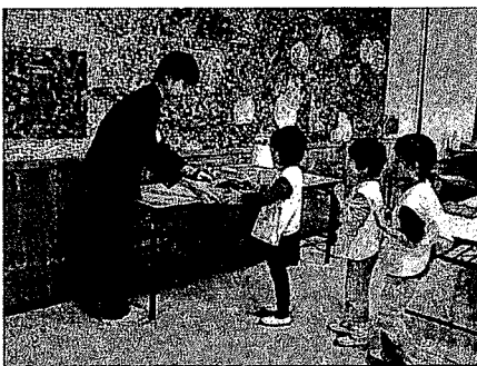
写真3 食器を取りに行く