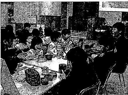
写真4 お弁当交流会1

手続き:Tクラス及びHクラスにおける活動の振り返りは、担任教諭によるクラス全体への問いかけから始められた。Tクラスでは「今からみんなに、どうだったかなーっていうのを、ちょっと聞いてみたいと思います」という問いかけが、Hクラスでは「どうだった?感想は?」という問いかけがなされた。両クラスともに、基本的には意見のある幼児が挙手をし、担任教諭の指名の後に1人ずつ発言した。各クラスでの振り返りの内容は、デジタルビデオで録画された。録画記録を文字化したものを分析対象とした。