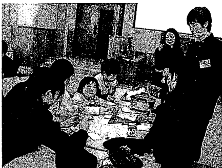
写真1 クリスマス・ツリーを作る