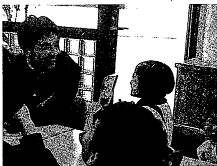
写真5 お弁当交流会2