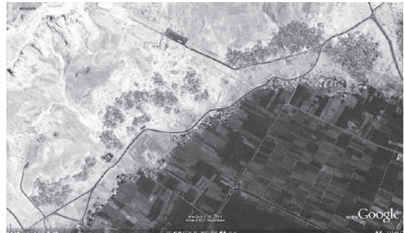
図6-1 住居撤去前のクルナ村の衛星画像（2002年）