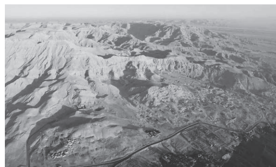
図3 空から見たテーベ・ネクロポリス（住居撤去後）

たミイラや墓の副葬品を盗掘し、不法に売買された歴史がある。古代の遺物が欧米人に高価で売買できることを知った現地の住民は、水の供