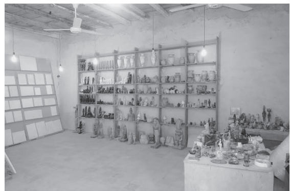
図8-3 土産店内（2017年1月撮影）