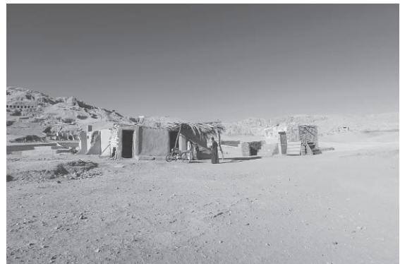
図8-1 住居撤去後に元あった場所に造られた土産店（2017年1月撮影）