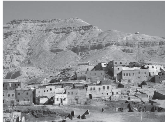
図4 墓地の上に並ぶクルナ村の住居

給が困難であるにも関わらず、古代の墓を住処とし、盗掘を行うようになった。こうした状況から、ヨーロッパのエジプト学者の中には先入観を持ってクルナ村の住民を盗賊だとみなしてきた研究者もいた。一方で、クルナ村はエジプト学の歴史と密接に関わっていたことも事実である。エジプト学の父と呼ばれる18世紀や19世紀のヨーロッパの研究者は村に居住し、村民たちと生活を営んでいた。たとえば、1798年から1799年のナポレオンのエジプト遠征に随行したヴィヴァン・ドノン 1 は古代の墓に住む村人とのやり取りについて記録している (Denon, 1803, vol. II: 86-97, 196-197; vol. III: 28-32, 47-88)。英国エジプト学の父とされるジョン・ガードナー・ウィルキンソン卿は、1821年から1833年までクルナ村で暮らしていた。彼の住んだ家にはその後も英国の研究者が滞在し、調査研究活動を続けていた。さらに村民は、外国の考古学者の発掘調査の主要な作業員として重用されてきた。例えば、有名なツタンカーメン王墓を発掘した英国の考古学者ハワード・カーターの発掘調査時の写真を見ると、多くの現地住民が発掘調査の作業員として働いている様子がわかる。発掘調査の作業員の多くは、古代の墓を住居として暮らしていた。ハワード・カーターがツタンカーメン王墓を発見する前の1899年に上エジプトの遺跡局長に任命された時、彼は、当時のエジプト考古局長官であったガストン・マスperoからテーベのネクロポリスの遺跡の保存状態を報告するように命じられ、クルナ村にある古代の墓を盗掘から護るために墓の入口に木製あるいは鉄製の扉の設置を推進した (van der Spek 2011:150)。さらにカーターの後継者であったアーサー・ウェイゴールは、遺跡の保護のために壁画の描かれた岩窟墓に住む住人を移住させた。さらに、次に上エジプトの遺跡局長となったエンゲルバッハは、1912年の遺跡保護法により、古代の墓は政府に帰属するものであり、墓に住む村民を「不法居住者」とみなしている (van der Spek 2011:152)。しかし、2度の世界大戦中は、クルナ村を監視するエジプト考古局の査察官が存在せず、外国の考古学者による発掘調査も継続されなかったことから、古代の墓