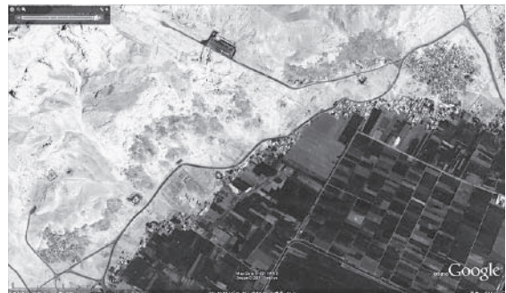
図6-2 住居撤去後のクルナ村の衛星画像（2009年）