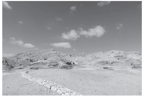
図7 住居撤去後のクルナ村シャイク・アブド・アル＝クルナ地区