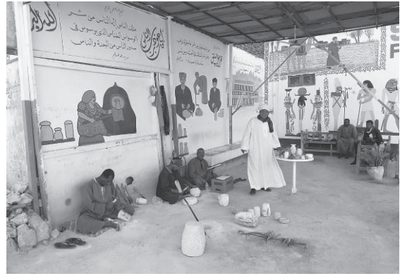
図5 クルナ村のアラバスター工房と土産店

クルナ村の住居の撤去が開始されると、外国人や撤去に反対するエジプト人考古学者を中