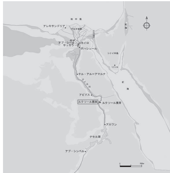
図1 エジプト全図。赤枠のルクソール西岸が本稿で扱う世界遺産の位置である。

古代テーベのネクロポリスが位置するルクソール西岸は今日クルナ村として知られている。18世紀末のフランスのナポレオンによるエジプト遠征後は、ヨーロッパで薬として売られ