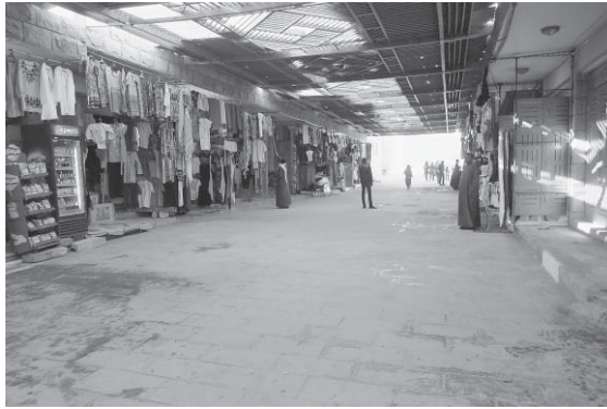
図9 王家の谷のヴィジターズセンターに併設された土産店（2017年1月撮影）

政府が建設したヴィジターズ・センターに併設して土産物屋などが配置され、政府主導で文化資源活用のための整備は進んでいるが、果たして現地住民の生活に還元されているかは大いに疑問である。