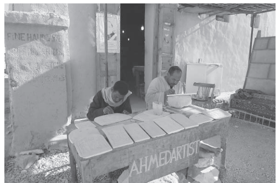
図8-2 土産物を作る村民（2017年1月撮影）