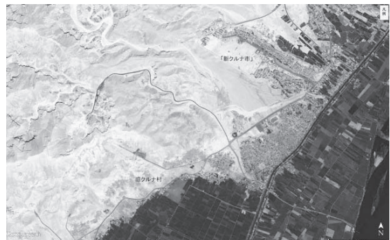
図6-3 旧クルナ村と「新クルナ市」