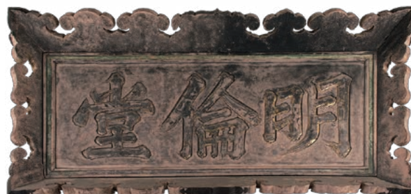
加賀藩校「明倫堂」扁額(1792年、新井白娥書)

これらは収蔵庫で大切に保管するとともに、その一部は資料館展示室で公開しています。また、インターネットによる公開も積極的に行っており、資料館Webサイト上での資料紹介に加え、高精細・多角的画像と詳細な学術データで構成される「金沢大学資料館ヴァーチャル・ミュージアム」でも貴重資料を順次アップしています。