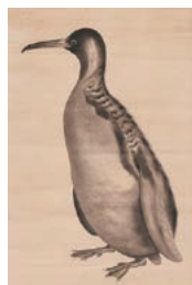
第四高等学校教育掛図 「企鵝之図」(水野治三郎画)

高精細画像で撮影した資料をWebサイト上で一般公開しており、現在約千点の資料が閲覧可能となっています。 ( http://kuvvm.kanazawa-u.ac.jp/ )