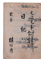
梅田家資料「日記式番」 (1864年)