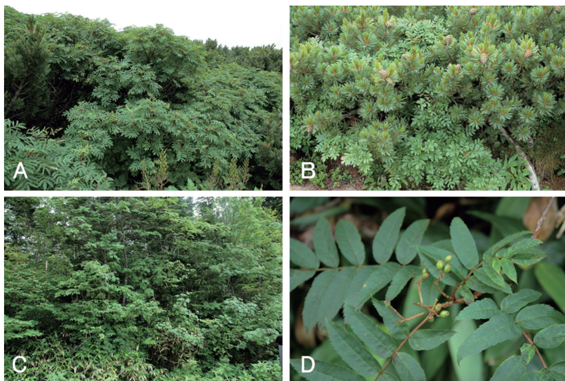
Fig. 2. A: The view of the Sorbus matsumurana community. B: The view of the Pinus pumila - Deschampsia flexuosa community. C: The view of the Betula ermanii - Sasa senanensis community. D: A hybrid individual between Sorbus matsumurana and S. commixta .

いまひとつは、葉の表面に光沢があり果実は楕円体であるが、高山帯に分布するタカネナナカマドよりも葉が著しく大きく、ナナカマドと同じ大きさの