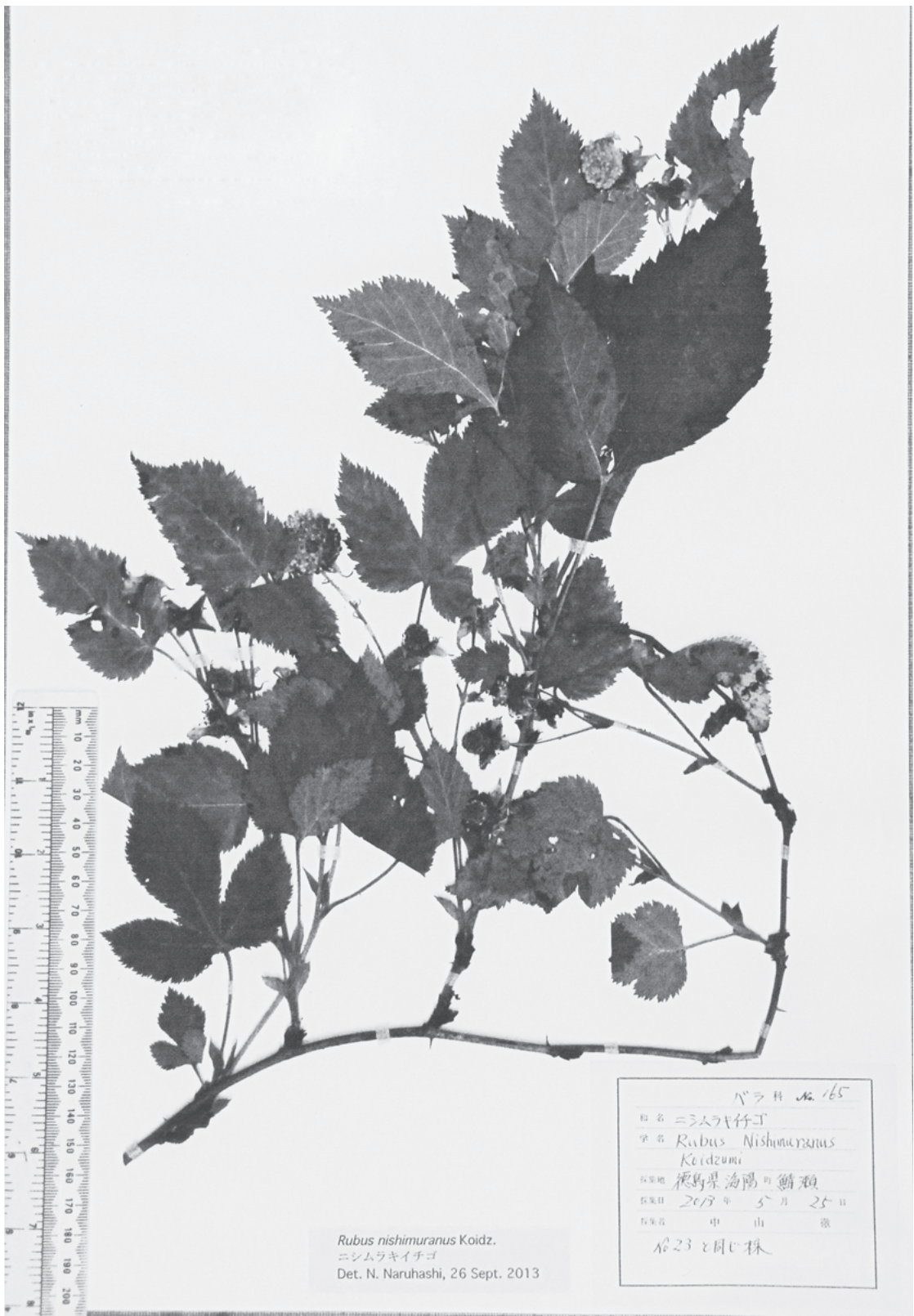
図2. 大阪市立自然史博物館に収蔵されている証拠標本の内の1点 (2013年5月25日採集).