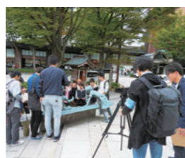
フィールドワークの様子を撮影する学生

高校生に地域創造学類を紹介する広報用映像を、金沢大学放送局web-KURSと共に制作しています。局員の学生らは、講義だけでなく学外での実習やインターシップにも同行し、その様子を撮影。さらに教員や学類生、卒業生へのインタビューを行いました。この映像は来年度に地域創造学類Webサイトで公開予定です。