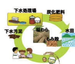
地域内循環のイメージ図

水環境工学研究室は国土交通省「下水道革新的技術実証事業」に採択され、鳥取環境大学、民間企業と共同で、稲わらと下水汚泥を高濃度混合高温消化・炭化する技術を核とした地域内循環システムに関する研究を推進しています。このシステムにより、高効率の下水処理技術が確立されるほか、温暖化ガス発生抑制につながる効果が期待されます。