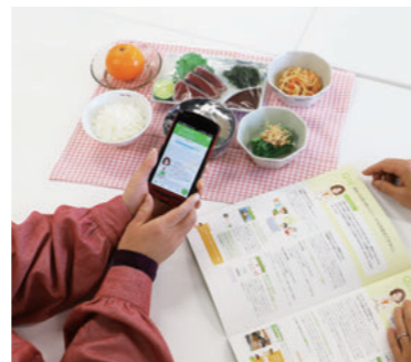
アプリを活用した特定保健指導の様子

※日本医療研究開発機構(AMED)「IoT等活用行動変容研究事業」: IoTデバイスを活用して収集した健康情報を基に個人の行動変容を促し、健康増進に関する効果の科学的根拠の構築と、新たなビジネスモデルの創出および社会実装を目標とする事業。