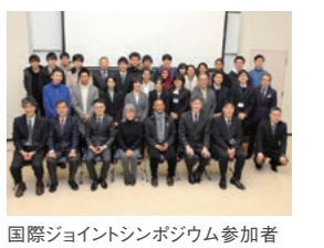
国際ジョイントシンポジウム参加者

12月17日、本学とタイのプリンスオブソンクラ大学(PSU)が合同で、海洋生物資源に関する国際ジョイントシンポジウムを開催しました。本学およびPSUからそれぞれ3名の研究者が、エビや魚などの増養殖と加工に関する研究発表を行いました。また、午後からはポスターセッションが行われ、有意義なシンポジウムとなりました。