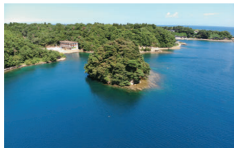
上空から望む九十九湾

来年度、石川県鳳珠郡能登町の協力を得て、能登半島の九十九湾沿岸に理工学域生命理工学類海洋生物資源コースの拠点となる「能登海洋水産センター」が誕生します。石川県の特性を生かした水生生物に関する基礎・応用研究をより一層推進するとともに、次世代養殖技術の開発を通じて地域産業に貢献できる人材の育成を目指します。本センターは、水生生物飼育室や実験室に加え、センターと本学角間キャンパスをつなぐ遠隔講義システムを有する大講義室などを備えています。また今後、国内外の学生・研究者が長期間にわたる研究に専念できるよう、センター内に宿泊棟を整備する予定です。