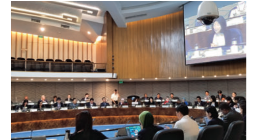
フィリピンで開催されたウイルス性肝炎対策の進捗会議

平成29年4月、本学は世界保健機関(WHO)から肝炎対策では世界4番目、肝臓がん対策では世界初のWHOコラボレーティングセンター(WHO-CC)に指定されました。WHO-CCはWHOと協働し、WHOが展開する国際的な保健プログラムに関する各国・地域の目標達成の一翼を担う重要な機関。本学はこれまでも、肝炎専門家をはじめとする研究者をWHOに派遣し、ガイドラインの策定などに携わってきました。本指定を受けて設置したWHO慢性肝炎肝臓がん協力センターは、国内のみならず国際的な肝疾患研究拠点として、WHO西太平洋地域事務局(WPRO)と共に東アジアにおける国際保健活動をけん引しています。