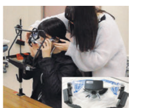
眼球運動測定装置取り付けの様子と、装着用アイカメラ(右下)

作業療法学専攻博士前期課程の学生2名が、日本高次脳機能障害学会において、眼球運動測定装置を用いた研究を発表しました。この装置は、刺激を発生させる別装置と連動して視線の詳細な解析が可能のため、高齢者や脳損傷者の空間的注意能力の解明に役立つことが期待されます。今後、臨床応用に向けて、研究をさらに進めます。