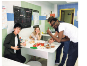
朝食を取りながらのラボミーティング

「大学の世界展開力強化事業」*1の支援の下、物質化学類と大学院自然科学研究科物質化学専攻の学生8名がロシアのカザン連邦大学で短期研究留学に参加しました。学生らは研究に取り組むとともに、異文化交流を行いました。また、タイへの留学プログラムにも5名が参加するなど、多くの学生が海外での研究経験を積んでいます。