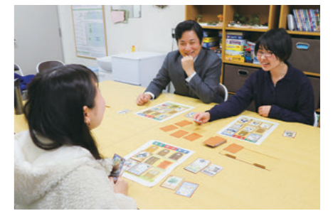
林准教授(中央)の指導の下、ゲームを制作

環境を整えていくゲーム。昼行性・夜行性・怖がりなどの属性を持った動物たちを住人に、隣室や階下に誰が住めば共に快適に過ごすことができるかを考え、ゲームで遊びながら住環境づくりを体験できるように工夫を凝らしています。「ボードゲームグランプリ」では、扱いにくいテーマを楽しむゲームにしたことが高く評価され、受賞につながりました。今後は、『ぼんぼこ不動産』の商品化や展示会への出展を目指すとともに、次の新しい挑戦に向けてさらに活動の幅を広げていきます。