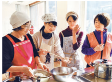
収穫祭では地域の食材を使って楽しく料理