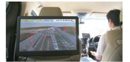
自律型自動運転自動車と走行中の車内の様子

※内閣府「戦略的イノベーション創造プログラム」：日本の経済・産業競争力にとって重要な科学技術イノベーションを実現するための国家プロジェクト。