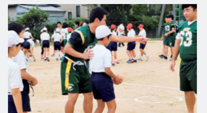
小学生にフラッグフットボールを指導する部員

フラッグフットボールは、アメリカンフットボールの「タックル」を「腰に付けたフラッグを取る」ことに置き換え、誰でも安全に楽しめるようにしたスポーツです。金沢大学アメリカンフットボール部では、地域のスポーツ教育支援活動として、平成29年から金沢市立杜の里小学校の5年生を対象にフラッグフットボールの指導を行っています。今年度は体育の授業の中で指導を行い、児童はフラッグを取り合う鬼ごっこなどをゲーム感覚で楽しみながら、ルールや技術を段階的に身に付けました。今後、他の小学校にも活動の場を広げていく予定です。