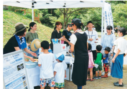
西侯ふるさとまつりでのブース出展

人間社会学域地域創造学類環境共生コースの農村戦略論ゼミは、過疎・高齢化が進む石川県小松市の西侯町および打木町で、地域振興に向けた活動に取り組んでいます。平成30年夏には、西侯町の恒例行事「西侯ふるさとまつり」にブースを出展し、町の文化・伝統の継承をテーマにした企画で祭りを盛り上げました。また、同年秋には、2つの町の住民が参加するワークショップをそれぞれの町で開催。豊かな自然が楽しめる施設が充実する西侯町と団結力をもって農業に取り組む打木町といった、それぞれの町の特長や強みを生かした地域振興策の創出を後押ししました。