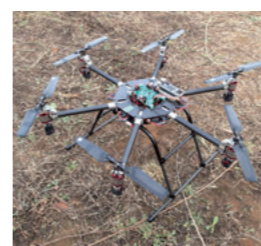
突風の中でも飛行できるドローン

フロンティア工学類では、内閣府「革新的研究開発推進プログラム」の支援を受け、災害現場などの極限環境でも仕事ができるロボットの実現を目指し、突風の中でも飛行できるドローンや、触覚センサを搭載した索状ロボットを開発しました。屋内および屋外での試験評価を通して、実際の現場でも使える技術であることを実証しています。