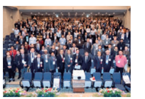
アジア太平洋プラズマ物理学国際会議参加者

11月12日から16日にかけて、電子情報通信学系の教員が現地実行委員の中心となり、第2回アジア太平洋プラズマ物理学国際会議(AAPPS-DPP 2018)が開催されました。また、サテライトワークショップとして、先魁プロジェクト*2「革新的デバイス創製を目指した次世代エレクトロニクス研究拠点の形成」の国際シンポジウムを実施しました。