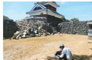
熊本城内の地盤を調査の様子

熊本城の石垣やイランの世界文化遺産など、歴史的建造物の耐震安全性に関する研究に取り組んでいます。熊本城の石垣については、熊本地震後の復旧に向け、文化庁や熊本市と連携して耐震補強の検討を進めており、各種補強法の提案などを行っています。