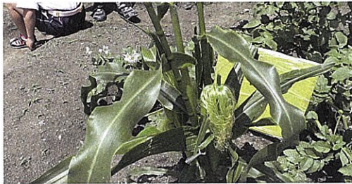
【写真3 7月1日のC16児の畑】

これらのことから、C16児はトウモロコシ復活への願いを強くもち、そのために水やりを一生懸命続けることで、最後収穫の喜びを味わうことができたのである。また、彼の本には自分の頑張りが多く書かれており、それを周りにも伝えたいと思っているC16児であると考えることができる。