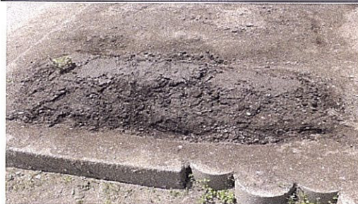
【写真 1 5 月 16 日の C16 児の畑】

では、C16 児はどのように活動を進めていったのだろうか。水やりがトウモロコシ復活のカギと考えた C16 児は 5 月 20 日の活動でこのように記述している。