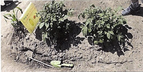
【写真2 6月6日のC16児の畑】

モロコシとジャガイモの成長を喜び、畑の看板を作ったり水をやったりしながら野菜を見守ったC16児は、その大きなトウモロコシを収穫し、その後「嬉しいな。家族で食べるんだ。」と喜びを述べていた。