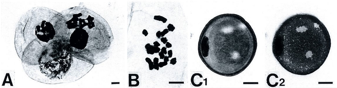
Fig. 2. Microgametogenesis in Lecanorchis hokurikuensis . A: Microspore tetrad showing non-synchronized division; B: n=18 chromosomes; C 1 : Mature pollen grain showing two nuclei, small vegetative nucleus (left) and large generative nucleus (right); C 2 : Mature pollen grain showing three pores on the surface. Bars represent 5 \mu\text{m} .

Aoyama et al. (1987) はムヨウランの 8 mm の蕾で花粉母細胞の減数分裂を観察しているが、ホクリクムヨウランでは 7 mm ですでに完成花粉の状態であった。ホクリクムヨウランの特徴の一つとして、ムヨウランと比べて花がほとんど開かないことが知られている。蕾の小さい時期に花粉が完成していることから、ホクリクムヨウランでは開花前にすでに自家受粉してしまっているものと思われる。またムヨウランでは小孢子が四分子塊を作らず遊離し、ほとんどが 1 核であると記載されているが (Aoyama et al. 1987)、ホクリクムヨウランでは小孢子は四分子を形成し、この状態で分裂して 4 個の 2 核性花粉が作られる。分裂は同調しておらず、代謝期の状態から中期染色体の状態のものまでが同時に観察された (Fig. 2 A)。この過程で観察された配偶子染色体数は n=18 であった (Fig. 2 B)。完成した花粉は花粉塊を作らず遊離し、大形で薄く染まる栄養核と小形で濃染される生殖核が観察され、花粉の表面に 3~7 個の不定形・不定大の発芽孔が観察された (Figs. 2 C 1 , 2 C 2 )。