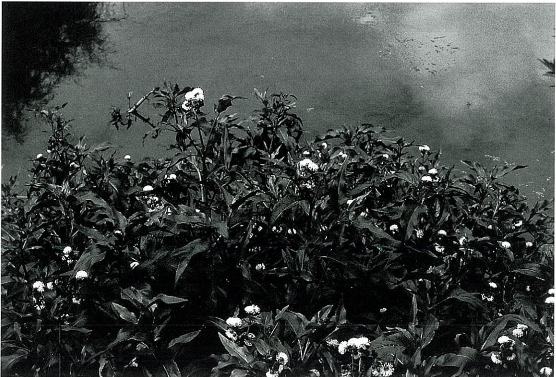
Fig. 1. Gymnocoronis spilanthoides growing on the riverside, Toyohashi, Aichi Pref.

豊橋市内およびその周辺地域での分布生育状況を調べたところ、1996年時点では、豊橋市内の梅田川とその支流にのみ帰化していた。本植物の散布は種子によるとされている (Cook 1990)。豊橋においても毎年6-11月の長期にわたり盛んに開花しているが、今のところ種子は全く確認していない。この植物がすでに帰化しているオーストラリアの Australian Association of Bush Regenerators (NSW) AABR Inc. では、実験の結果、種子の稔性は1%未満であることをインターネットのホームページで報告している ( http://www.zip.com.au/~aabr/news/regional_news/qld/qld02.html )。また、ちぎれた茎は節から盛んに側枝や根を出し、短期間で大きなコロニーへと成長する。これらのことから、豊橋市におけるミズヒマワリの帰化は、近隣の栽培品が逸出したことによるものと思われる。