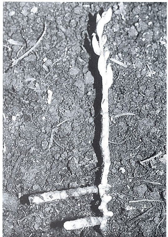
Fig. 2. A fruiting stem of Hetaeria sikokiana in the same place. Aug. 18, 1993.