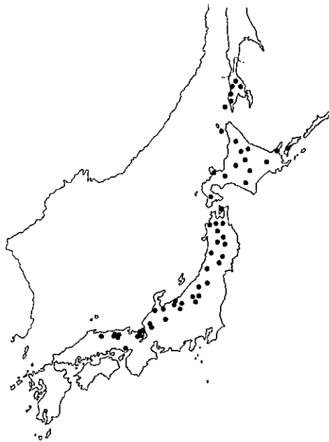
Fig. 1. Distribution map of Clinopodium sachalinense KOIDZ. (Added to OKUYAMA, 1982)