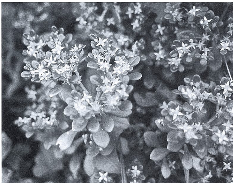
図 1 ハママンネングサ (男女群島女島, 1989 年 10 月 3 日伊藤秀三撮影)

(*〒 852 長崎市文教町 1-1-89, 長崎大学教養部生物学教室 Botanical Institute, Faculty of Liberal Arts, Nagasaki University, Bunkyo-machi, Nagasaki-shi, Nagasaki 852; **〒 850 長崎市弥生町 666 長崎女子短期大学 Nagasaki Women's Junior College, Yayoi-machi 666, Nagasaki 850)