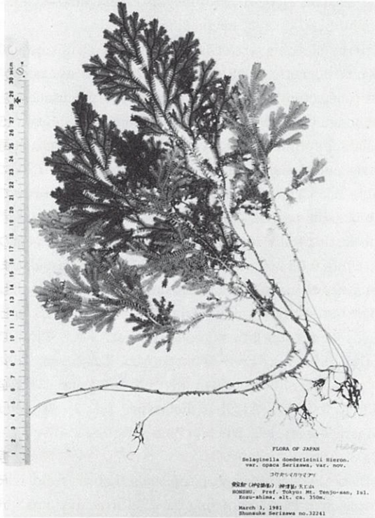
Fig. 1. コウズシマクラマゴケ Selaginella doederleinii var. opaca (holotype)

ある。この種は奄美大島以南の琉球列島では林内の崖状地などに普通に見られ、小さなものは半匍匐性であるが大形のものには茎の上部が斜上して立ちあがり、高さ30~40cmに達する。葉はやや硬く、深緑色で光沢があり、腹葉は長