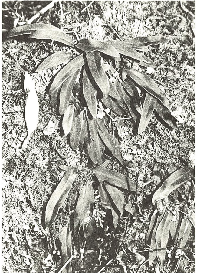
Fig. 1. 八代産“イワダレヒトツバ”

P. davidii : 根茎は匍匐し、径1.5~2 mm, 鱗片で密におおわれる。鱗片は披針形、長さ1.3~2.8mm, 幅0.3~0.5 mm, 中央部は暗褐色、周辺部は淡色となる。葉は1~4 mm 間隔でつき、葉柄は長さ0.7~3 cm, 葉柄基部の鱗片は披針形、長さ1.5~3.5mm, 幅0.4~0.6mm, 淡褐色で先端中央のみやや濃色となる。葉身は倒披針形、乾燥標本で長さ2.5~18cm, 幅0.5~1.2cm, 中央部よりやや上が最も