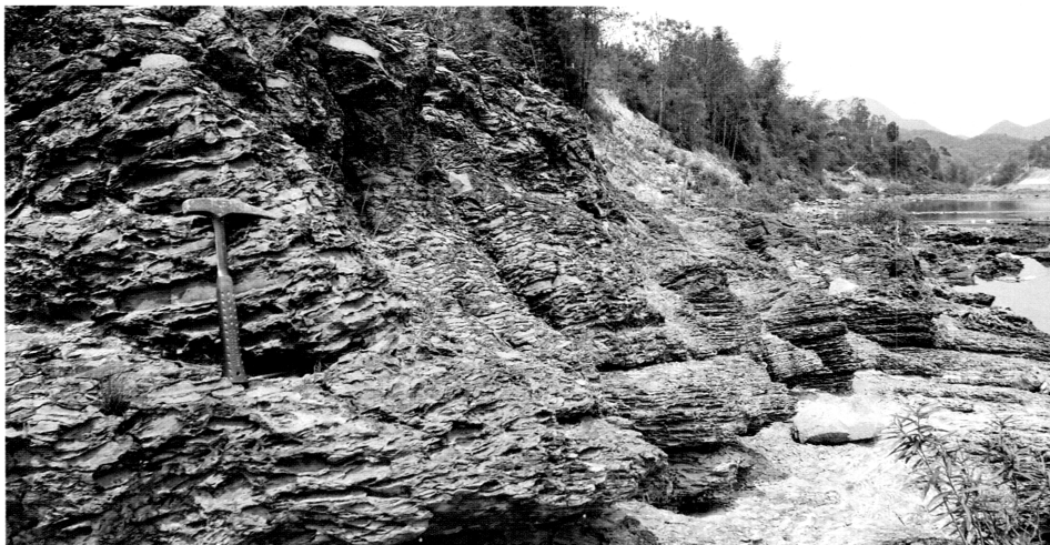
図3. 下部三畳系バックテウイ層の石灰角礫岩 (ランソン地域キーコン川沿い). 石灰角礫岩は, 礫支持あるいは基質支持の典型的な土石流堆積物で, 孤立型炭酸塩プラットフォームの斜面相を形成していた (Komatsu et al. , 2014).