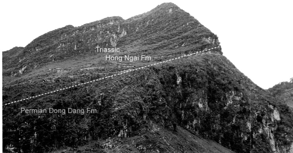
図2. ハーザン省ドンバン地域のルンカム (Lung Cam) セクションにおけるペルム系ドンダン層と下部三畳系ホンアイ層. ホンアイ層最下部からは, 三畳紀の始まりを告げるコノドントの Hindeodus parvus が産出する.