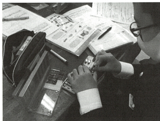
図2 イメージ通りの光を求めて繰り返し実験を行う様子