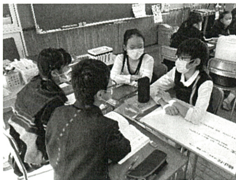
資料1 グループで話し合っている姿