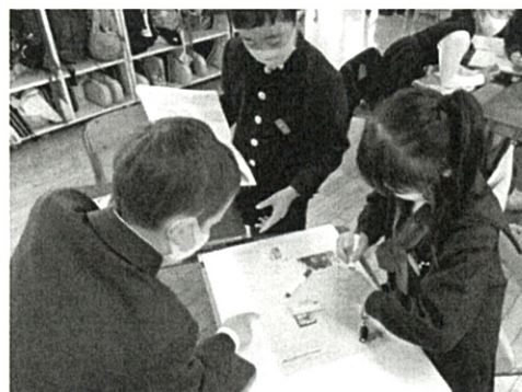
資料2 話し合いの様子