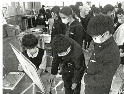
資料2 ワールドカフェ形式で説明している姿