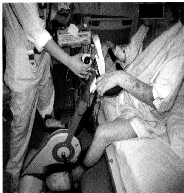
図2 電動エルゴメーターでの下肢筋力トレーニング

9病日目より、日中の活動向上を目的として担当看護師の監視の下、日中ベッド上座位にて過ごす時間を延長した。しかし、本症例では運動耐容能低下を認め、端座位で下肢の自動運動を行うのみの負荷量においても自覚的な疲労の訴えが「ややきつい」を超えていた。そのため、運動耐容能の改善を目的に理学療法では電動アシスト式サイクルエルゴメーターにて下肢筋力トレーニングを開始した (図2)。負荷量は1回5分ほどで設定は全介助のモードから開始し、ペダルの抵抗量は変化させず、20分を目標に駆動時間のみ延長していった。また、トレーニングの前後で下肢荷重力 15) および徒手筋力計にて等尺性膝伸展筋力 16) を測定した。等尺性膝伸展筋力測定はアニマ社製等尺性筋力測定装置 ( \mu TasMF-01) を用いた。測定は左右2回行い平均値を記録値とした (表1)。