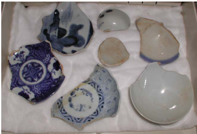
Fig. 27 江差町鷗島前浜引き揚げ品