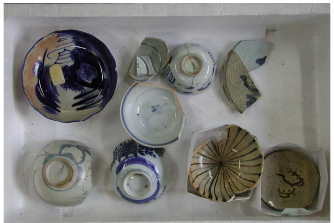
Fig. 18 上ノ国漁港遺跡出土品