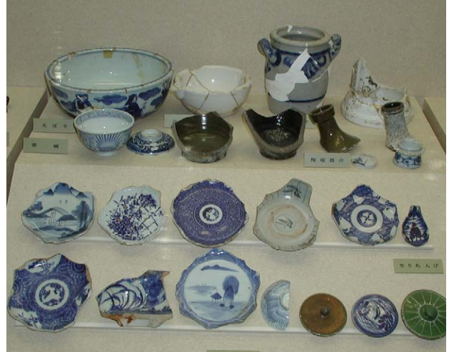
Fig. 20 江差町開陽丸引き揚げ品