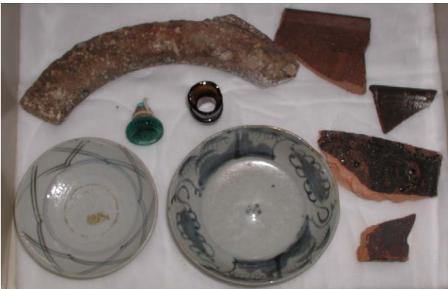
Fig. 29 江差町鷗島前浜引き揚げ品