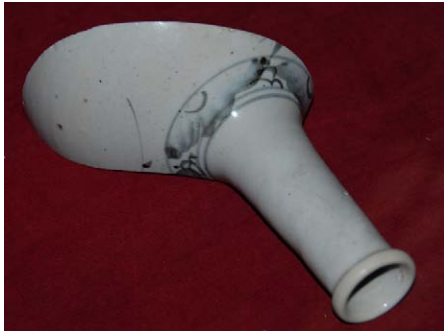
Fig. 34 染付徳利、碗、皿。江差町鳴島前浜引き揚げ品、中村家展示品。