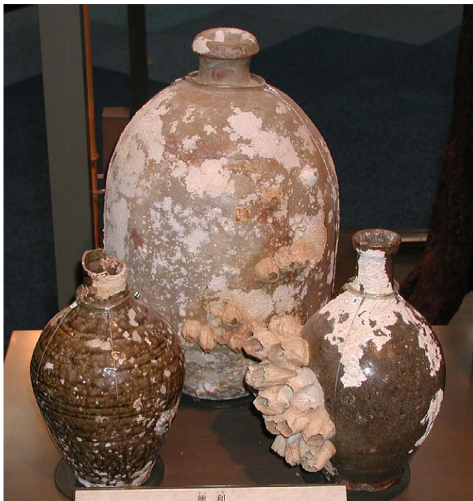
Fig. 3 脇野沢海底引き揚げ品、青森県立郷土館保管品