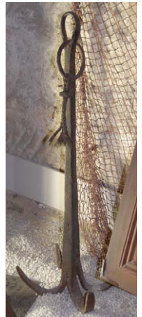
Fig. 37 函館沖海底の海揚げり4爪鉄錨。函館市高田屋嘉兵衛資料館展示品。長さ235cm、225cm、200cm、170cm、112cm、90cmの6点。