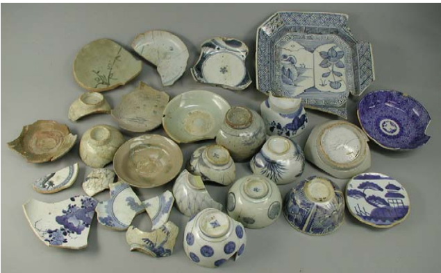
Fig. 13 上ノ国漁港遺跡出土品