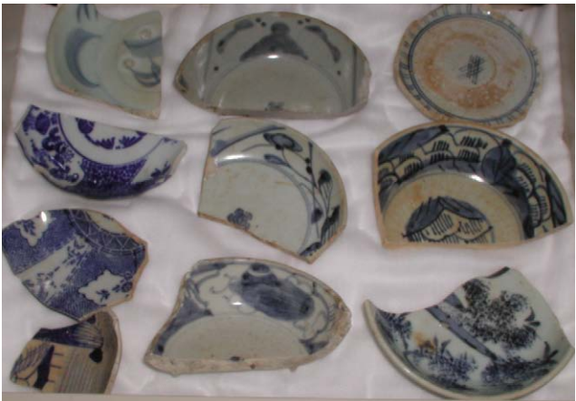
Fig. 28 江差町鷗島前浜引き揚げ品