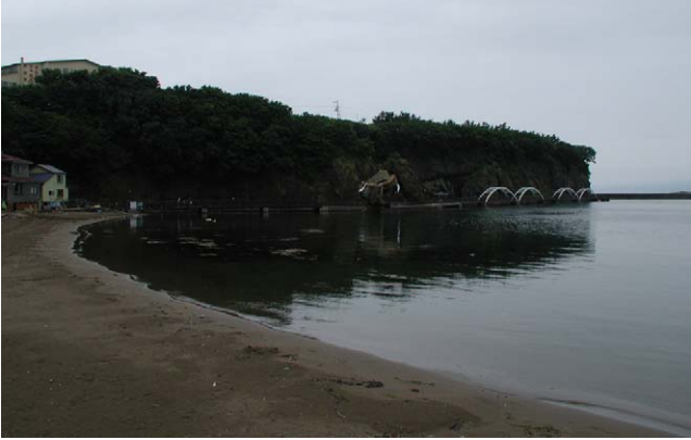
Fig. 26 江差町鷗島前浜