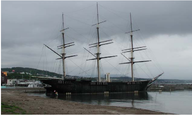
Fig. 19 江差町開陽丸復元