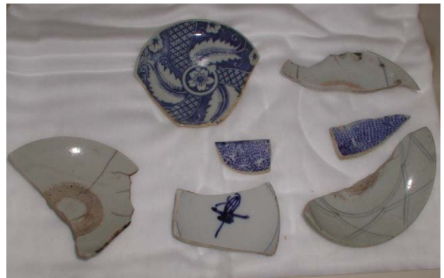
Fig. 31 江差町鷗島前浜引き揚げ品