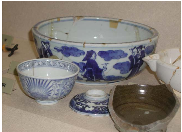
Fig. 22 江差町開陽丸引き揚げ品