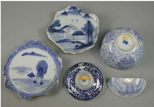
Fig. 23 江差町開陽丸引き揚げ品