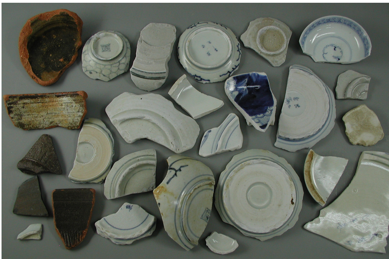
Fig. 10 松前町小松前川河口海岸、佐藤雄生さん採集品。