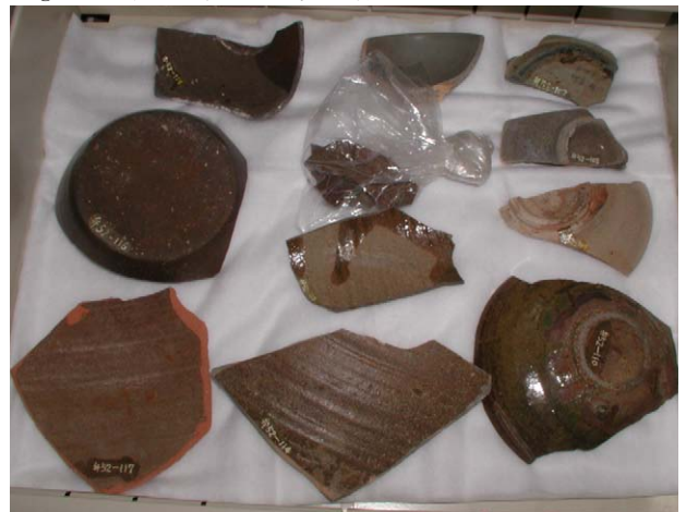
Fig. 32 江差町鷗島前浜引き揚げ品