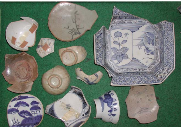
Fig. 15 上ノ国漁港遺跡出土品