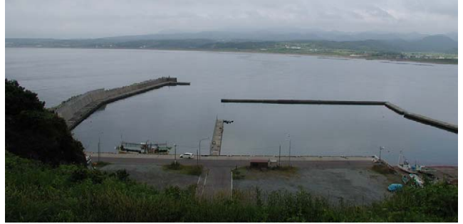
Fig. 12 上ノ国漁港、2010年7月