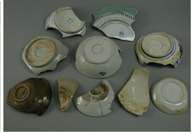
Fig. 30 江差町鷗島前浜引き揚げ品