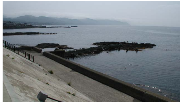
Fig. 7 松前町道の駅前海岸