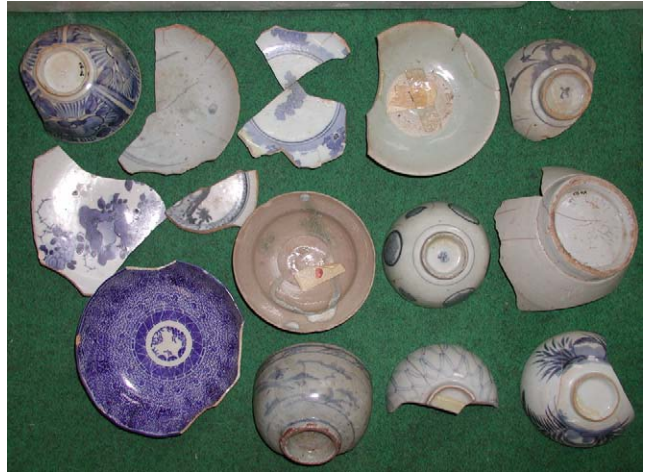
Fig. 14 上ノ国漁港遺跡出土品