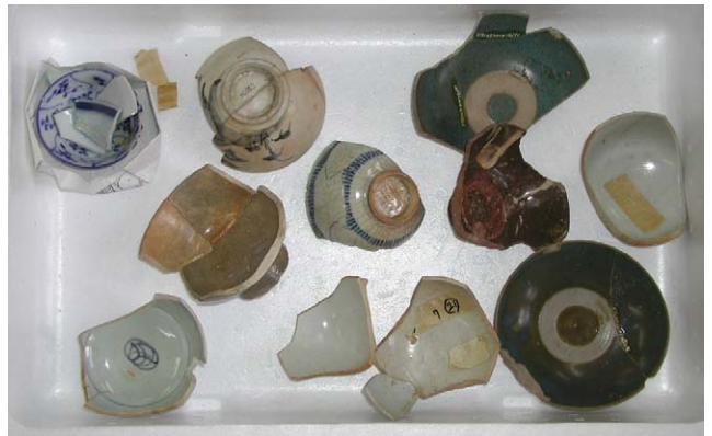
Fig. 16 上ノ国漁港遺跡出土品