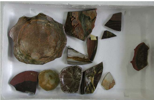
Fig. 17 上ノ国漁港遺跡出土品