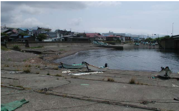
Fig. 9 松前町唐津内沢川河口海岸と採集品・金沢大学考古学研究室保管。