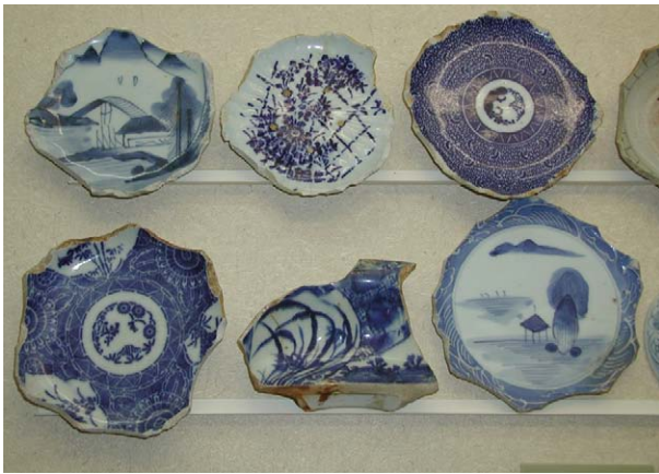
Fig. 21 江差町開陽丸引き揚げ品