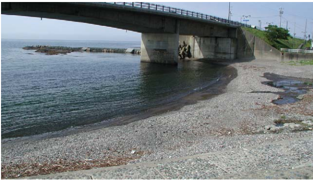
Fig. 6 松前町小松前川河口海岸