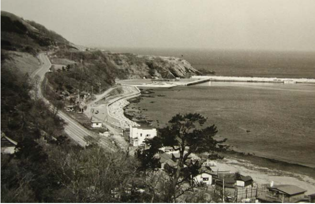
Fig. 11 上ノ国漁港遺跡 (報告書より)