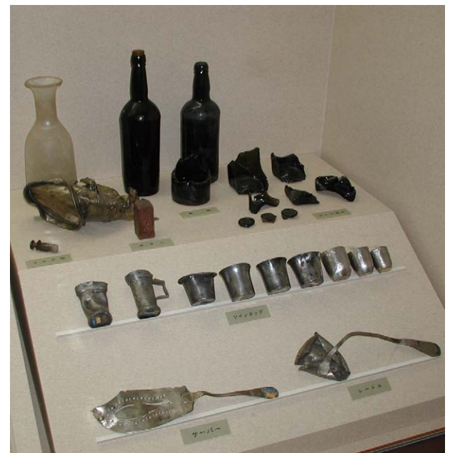
Fig. 25 江差町開陽丸引き揚げ品