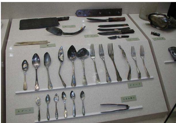
Fig. 24 江差町開陽丸引き揚げ品