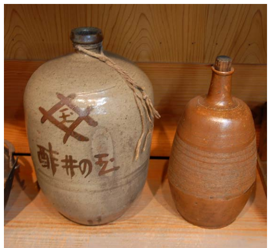
Fig. 4 青森県立郷土館展示の玉の井酢瓶