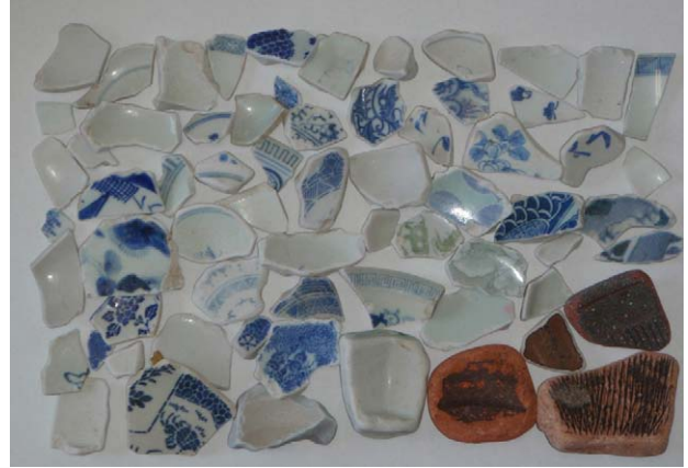
Fig. 5 松前町小松前川河口海岸採集品・金沢大学考古学研究室保管