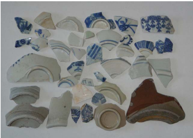
Fig. 8 松前町道の駅前海岸採集品・金沢大学考古学研究室保管。