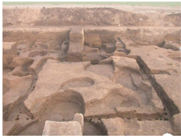
图二 房址示例。左：F21 土坯墙局部（早期房址）；右：F25（中期房址）