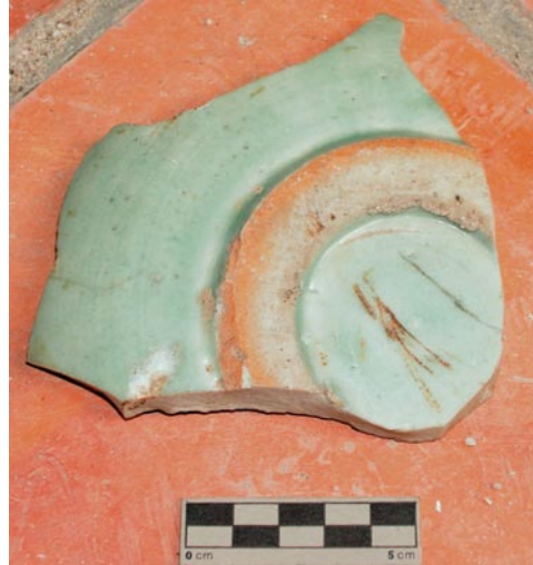
圖 5: 刻花紋青瓷盤 (感謝陳達生先生提供標本)