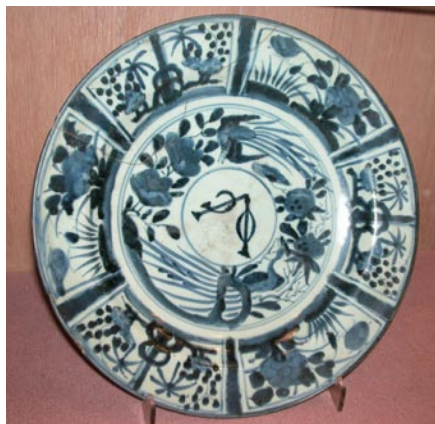
圖 2: 開光花鳥紋 VOC 字文青花大盤