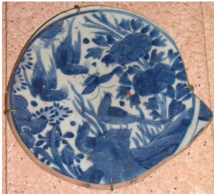
圖 1: 錦地開光花鳥紋青花盤

間，麻六甲被視為印度領地 ( Estado da India ) 的第二大城，是貿易與宗教的中心，而東南亞的香料、印度 Gujerat 與 Coromandel 的布料皆以該城為主要集散地，日本與中國的物資，也要經過麻六甲轉運到西方 (Newitt 2005:165-167)。到了1641年，麻六甲城再度易手，歷經5個月的圍困，葡萄牙人最後開城投降，麻六甲成為荷蘭東印度公司 (VOC) 在亞洲的眾多據點之一。荷蘭人經營麻六甲期間(1641-1824)，日本肥前瓷器亦為重要商品，有關當地所見肥前瓷器及其貿易狀況，歷來罕見報導，本報告主要目的，