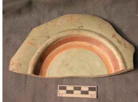
圖 6: 印花紋青瓷盤 (感謝陳達生先生提供標本)