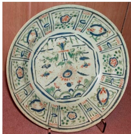
圖 4: 錦地開光園景花盆紋加彩盤