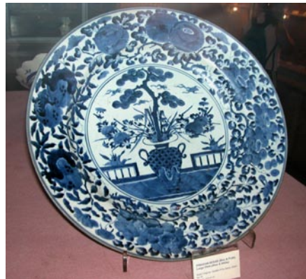
圖 3: 園景花盆紋青花大盤