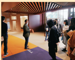
床の色で場所がわかる工夫