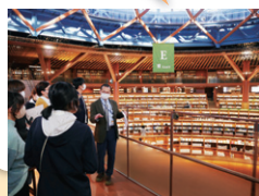
ブリッジで説明を聞く参加者

3階のブリッジがおすすめの場所です。空中に浮いたリビングのような空間で、図書館内をぐるり360度見渡すことが出来ます。