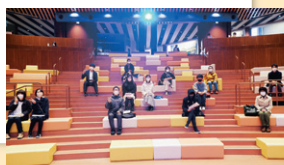
文化交流を目的としたエリア

県立図書館独自の12のテーマで分類された7万冊の図書やいろいろな椅子を配置するなどして作り出した心地よい閲覧スペース、文化交流を目的としたエリアで行われる多彩なイベントが図書館好きだけでなく、多くの人たちを惹きつける魅力になっています。