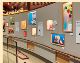
尾谷さんおすすめ 「本との出会いの窓」