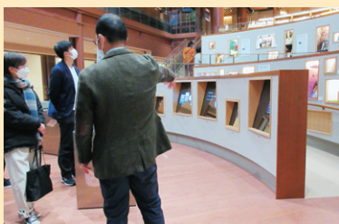
「本との出会いの窓」での説明