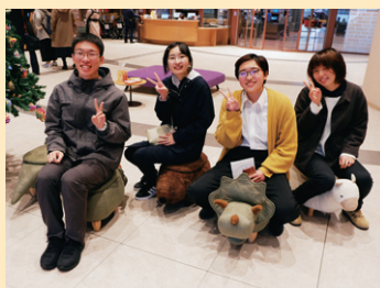
ツアーに参加したとぼらメンバー