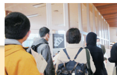
サイレントルーム前での説明

県立図書館は「会話のできる図書館」です。静かな場所で過ごしたい人はサイレントルームをご利用ください。こちらにも予約が必要です。