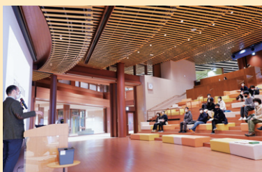
だんだん広場での説明

た様々な椅子は利用者にとって心地よい居場所になっていました。従来の図書館機能だけでなく、様々な文化交流も目的にしており、コンサートやものづくり体験などの様々なイベントを開催しているとのことでした。説明後の自由行動の時間には、参加者は本を閲覧するだけでなく、利用カードを作ったり、いろいろな椅子を試してみたり、映えスポットで自撮りしたりするなど、石川の新しい知の殿堂を思い思いに楽しんでおり、大満足の見学ツアーになりました。