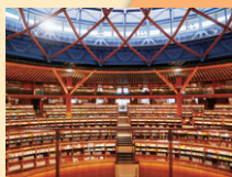
独自のテーマで分類された本棚

県立図書館がリニューアルしたことで、新たな魅力がたくさん増えたと思いますが、具体的にどのような魅力がありますか？