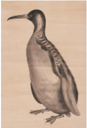
第四高等学校教育掛図「企鵝之図」(水野治三郎画)

高精細画像で撮影した資料をWebサイト上で一般公開しており、現在約千点の資料が閲覧可能となっています。 ( http://kuvvm.kanazawa-u.ac.jp/ )