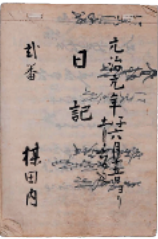
梅田家資料「日記式番」(1864年)