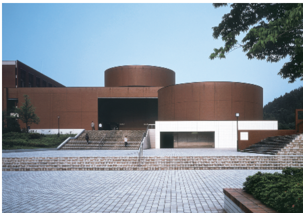
中央図書館・資料館棟(右側の円形部分が資料館です)