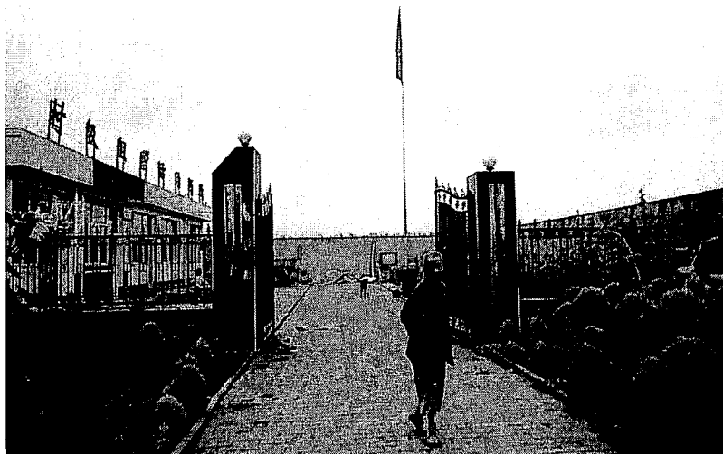
写真3. 陽高県獅子屯郷后営村村民委員会

また、村民委員会に到着すると(写真3を参照)、村の幹部に動員されたのが、老人をはじめとする20人余りの村民が着席しており、窓の外には多くの女性や子供たちが集まって来て中の様子を窺っていた。