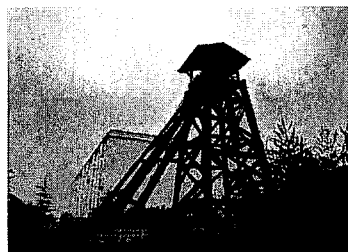
写真8. 井陘炭鉱「老井」