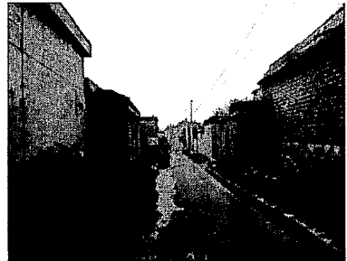
写真6. 北正村内の通り