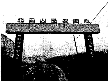
写真5. 北正郷北正村への入口