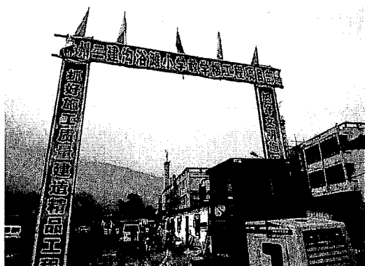
写真4. 建設中の溝峪灘小学

また、本村は汾河沿いに位置しているので、汾河を利用した灌漑が整備されており、農産物の生産性が相対的に高い。かつては農業が中心で、食糧は現在でも自給することができ、夏は小麦・豆類を収穫し、秋は玉蜀黍を収穫している。なお、蔬菜(灌漑が整備されているので蔬菜栽培が盛んになってい