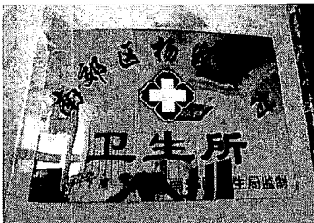
写真1. 楊家窰村衛生所の看板

当該村は大同市政府が推薦する模範農村で(写真1を参照)、全村民がかつて山の斜面にあった村から新築の豪邸が建ち並ぶ現在の「新農村」に移住しており、田舎の香り(家畜などの糞尿の匂いか?)が立ちこめてはいるものの、すでにいわゆる農村の風貌は完全に失われている。8月12日午後、村に至る道路は舗装・拡張の工事をしていたために迂回して村へ行かざるをえず、約1時間半を要した。その途中の畑で栽培されているのは大部分が玉蜀黍で、一部に粟や向日葵が見られた。