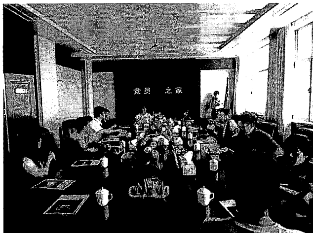
写真2. 楊家窰村副書記主催による説明会

現在、本村内には8つの企業(株式会社)があり、51%の株を村民委員会が所有し(その収益を村民の福利厚生のために使用)、残りの49%を村民が所有している。この8つの企業では主に本村人が働いているが、本村内にある炭鉱企業は国家の所有で、賃金が低いので、本村人で働く者はほとんどおらず、主に周辺の村民が働きに来ている。解放前、本村は、土地が瘠せ、灌漑設備もなく、土地生産性が低かったので、貧しく、人口も少なかった(食糧は自給していた)。