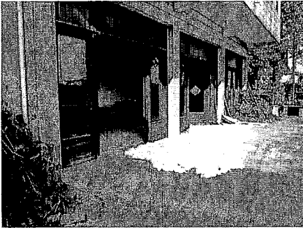
写真8. 農家の前庭で乾燥させている棉花