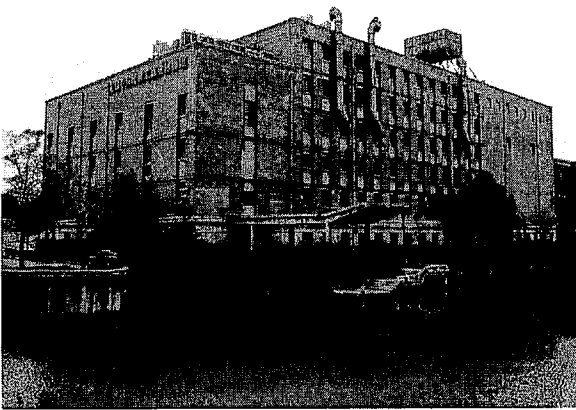
写真3. 新申三廠(現在、中国民族工業博物館)

たので、約1時間半かけて歩いて行った。栄家企業の新申三廠(現在は民族工業博物館となっている。写真3を参照)の近くにあったという)から5斤の棉花と1日当たり5～6銅元の加工費を受け取り、10打の靴下(12足で1打)と交換した。