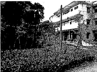
写真6. 一般農家と桑・蔬菜