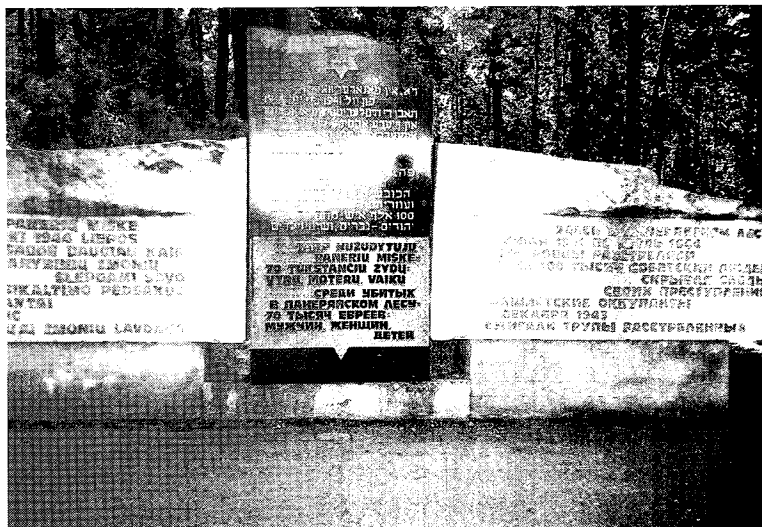
図1 ポナリの森にたつ慰霊碑 ソ連時代に建てられたリトアニア語(左)とロシア語(右)の慰霊碑(碑文については本文167ページ参照)にはさまれて、現在では中央に、上から順にイディッシュ語(注5)参照)、ヘブライ語、リトアニア語、ロシア語で書かれた慰霊碑が建っている。イディッシュ語の碑文では、リトアニア人の関与と犠牲者の大半がユダヤ人であったことが次のように明記されている。「ここポナリの森で、1941年から1944年までのあいだに、ヒトラーに率いられた占領者とその現地協力者が10万の人々を殺害した。そのうち7万人はユダヤ人である。」

にリトアニアがソ連に組み込まれたことによって損害を受けたと感じた社会のくずたちであった。また、このような者たちの犠牲者として強調されたのは、ユダヤ人というより、ドイツ軍の侵攻前に逃げるができなかった共産主義者や、ソ連の諸組織のメンバーたちであった。そして彼らブルジョア・ナショナリストこそ、1944年のソ連によるリトアニアの解放後、森に潜み、海外の帝国主義国の秘密諜報機関と結びついて反革命活動を継続した者たちだとされた。