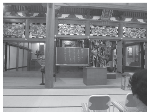
写真4 (2013年8月25日)

祠堂経の最後に全員でした読経でも「赤本」に載っている経を読んだのだが、この経に関してはほぼ全員が経を覚えており、暗唱していた。ほかの行事の際にも、最後に全員で読経している経なのだろうと感じた。