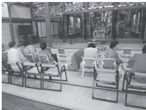
写真1 (2013年8月25日)

説教代として200円回収された。こちらも、「おみやかし」と同様に門徒総代がカゴを持って回収してまわっていた。