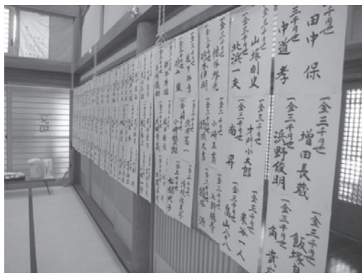
写真2 (2013年8月25日)