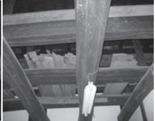
写真2 屋根裏の様子