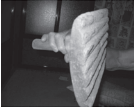
写真1 茅葺き屋根に使う「がげ」