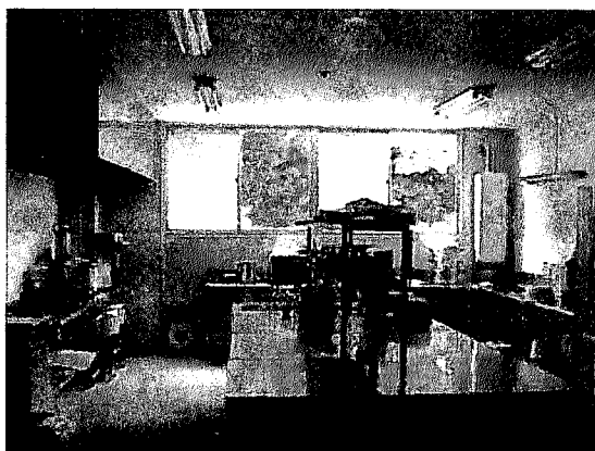
写真2 調理場の様子

へんざいもんのある能登半島 里山里海自然学校では、食育推進事業を NPO 法人すず交流ビューローと連携して進めている。里山マイスター養成プログラムを始めることになったとき、市役所から受講生たちの昼食のお世話などをしてほしいとビューローに声がかかった。それなら食堂を作ろうということで、国土交通省半島振興室の半島地域ネットワーク形成（食の拠点づくり）事業に応募し、モデル地域に採択された。これを契機に、旧小泊小の調理場を整備し、補助金で道具を買いそろえ、2007（平成19）年12月にへんざいもんプレオープン、翌1月に本開店した。毎週土曜日の昼食時、主に里山マイスター養成プログラムの受講生や自然学校スタッフ、地域の人々などに利用されている。