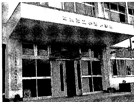
写真1 能登半島 里山里海自然学校

「能登半島 里山里海自然学校」は、里山プロジェクトが三井物産環境基金の支援を受け、廃校となった旧珠洲市立小泊小学校の校舎を利用して2006（平成18）年10月に設立された。生物多様性調査と自然共生型社会づくりの研究交流の拠点とされている。自然学校の行う活動には、「里山里海メイト」による里山里海保全活動や、地域の小中学校、高校や大学、住民を対象とした自然観察・