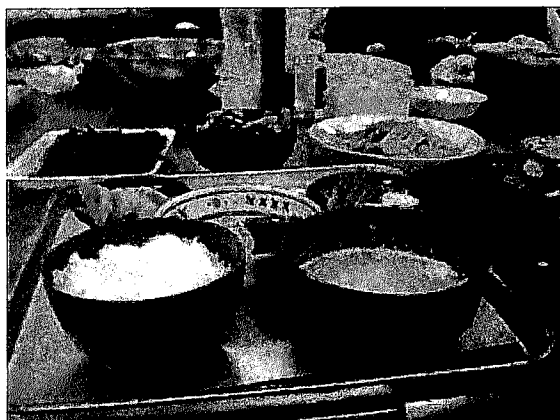
写真4 いただいたお昼ご飯

お客さんが帰ってしまった後は、片付けをしつつ自分達のご飯の準備をした。余ったものを食べるのだが、今回は予約なしのお客さんが多く、おかずが少ないかもしれない私のことを気遣って、卵焼きを作ってくださいました。このときいただいたものの中で初めて食べたのは、さといものきなこ和え・すりわり汁・いもの茎の煮物だった。さといものきなこ和えは、思っていたよりおいしくいただけました。いもの茎の煮物は、さといもの茎を使っていたようで、食べられるものだとは思っていませんでしたので驚いた。すりわり汁は、里山レシピによるとすりわり汁は生の枝豆を使うようだが、へんざいもんでは大豆が使われていた。昔は大豆をするためにすり鉢を使っていたが手間がかかるので、ミキサーを使っているとのこと。その他いろいろとお話しながら食事をした後には、片付けをした。いつもは片付けの後に次回のメニューを決めるそうだが、来週12日は自然学校の収穫祭（餅つきを行うとのこと）で通常へのんざいもん営業はお休みなので、調理場の冷蔵庫にある野菜をどうするかなど話していた。