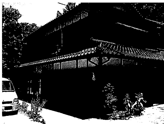
写真3 2006年に改築された家の概観

1937年建設で、築70年の家である。まず、40年ほど前に、煙が出るばかりで不便なだけであった囲炉裏をつぶして薪ストーブにした。このため部屋を二つにすることが出来たらしいが、「便利になる時は何も思わなかったが、今になると少し寂しい」とも言っていた。この時に二階も作ったという。そして2006年度に、大工さんの勧めで家の中を改築した。土台がしっかりしているので、骨組みは自体はまだ100年も200年ももつらしい。家の中にしきり