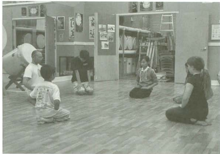
写真5 礼儀作法も一緒に教えるソノマ郡太鼓の練習風景

場合、太鼓はパフォーミング・アートのひとつとして位置付けられ、日本文化の文脈で語られることは少ない。ただしこれは、第2節で述べたサンノゼ太鼓・キンナラ太鼓とサンフランシスコ太鼓道場の演奏スタイルの違いに起因する可能性もある。