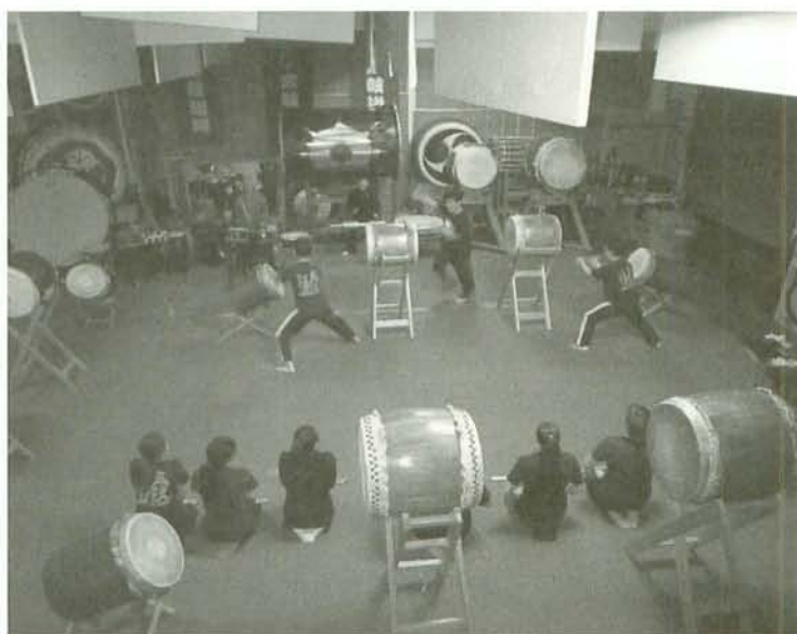
写真1 サンフランシスコ太鼓道場の練習風景

和泉(2008)は、アメリカの太鼓チームを文化混交の観点から三つに類型化しており、本稿で考察を進めるにあたってかなり参考となる。第1のタイプは、サンフランシスコ太鼓同道場を典型とするもので、彼は「オリエンタリズム型文化移植」と名付けている。すなわち、欧米文化の対局に位置するものとして日本文化をとらえ、太鼓はこうした