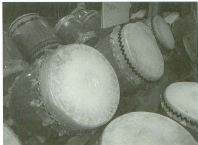
写真 4 バイエリアの太鼓チームで用いられているワイン樽太鼓

前節では、日本の太鼓とアメリカの太鼓が相互に影響を及ぼしながら普及していったが、アメリカでの太鼓の発展を支えた要素として、日本の太鼓との関係以外にも様々な要素がある。多くの人がアメリカの太鼓演奏に特徴的なものとして挙げるのは、ワイン樽を材料として用いる太鼓である。日本では太鼓の胴材としてケヤキが用いられることが多い。しかし、アメリカではケヤキが手に入らず、かといって日本の太鼓メーカーから輸入するには非常に高価である。日本の著名な太鼓のプロチームであれば購入資金を調達できるが、草創期にあって資金をもたないアメリカの太鼓チームにとって太鼓を確保すること自体が困難であった。サンフランシスコ太鼓道場では、入門してしばらくの間は自動