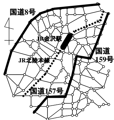
図-1 対象とした金沢道路ネットワーク

モデル適用のために使用した OD 交通量の平均は, 平成 7 年の第 3 回パーソントリップ調査をもとに作成した平日の朝 7 時から 8 時の OD 交通量とし, OD 交通量の分散はネットワーク内の交通量データにより \eta=42.0 とした. また, 旅行時間関数は標準的な BPR 関数のパラメータを用いた. なお, 計算は Frank-Wolfe 法を用いている.