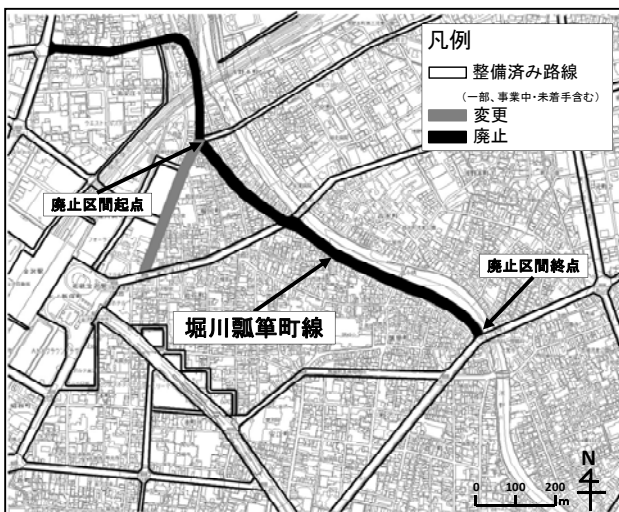
図-2 堀川瓢箪町線廃止区間位置図