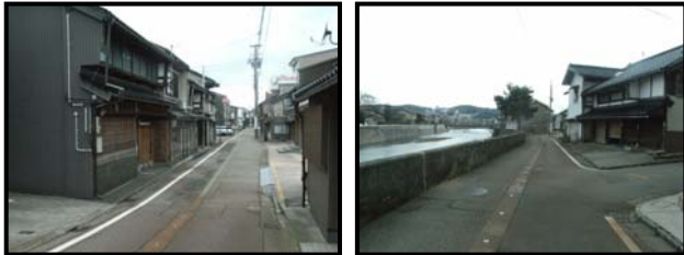
写真-1 堀川瓢箪町の計画沿道地区