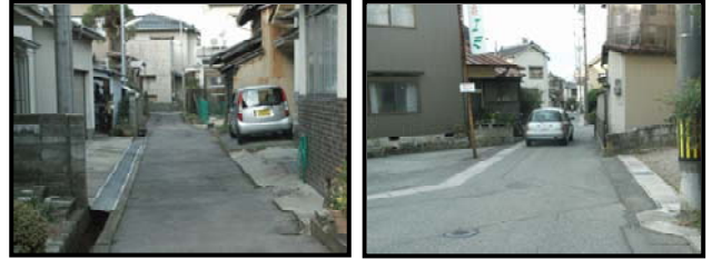
写真-2 和倉中町線の計画地区