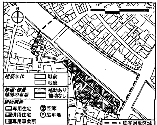
*金沢市主計町伝統的建造物群保存対策調査(2001年度実施)の対象区域を調査対象区域とした。本区域は全域が伝統環境保存区域「主計町・彦三町区域」に含まれる。